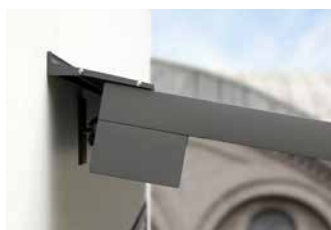
Un successo a tutto tondo

Gli highlight con faretti-LED o con LED-line sotto il cassonetto, nelle guide laterali e/o sotto il rullo di supporto garantiscono bellissime ore all'aria aperta – anche quando il sole è tramontato da tempo.