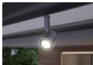
Faretti LED nel tubo frangivento