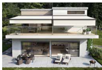
Tende da sole a pergola accoppiate